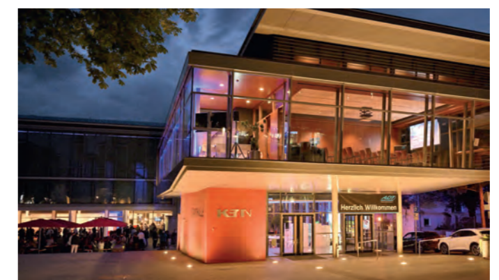
Stand: 28. Januar 2025

LAGE Ca. 15 km vom Flughafen Stuttgart entfernt Taxi (max. 4 Personen) ca. 55 € Ca. 25 km von Stuttgart Ca. 3 km zur A8 (Auffahrt Wendlingen-Nürtingen) 3 Min. Fußweg vom Bahnhof Nürtingen